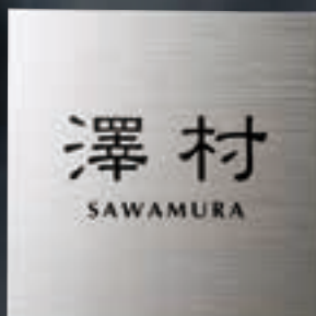
TI-2 チタンHL(黒) 28,000円(税抜) ● 180W×180H×2T(mm) 約290g ● 書体: 細隸書&オブティマ