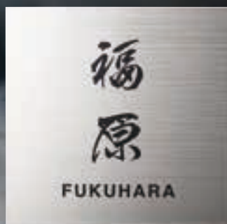
TI-6 チタンHL(黒) 32,000円(税抜) ● 200W×200H×2T(mm) 約360g ● 書体: サムライ書体&ヘルペチカ