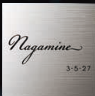
TI-1 チタンHL(黒) 32,000円(税抜) ● 200W×200H×2T(mm) 約360g ● 書体: ウィスカーサイン&アバンテ

チタン 素材 | 「軽い」「強い」「錆びない」多彩なメリットを持つ最先端の実用金属です。(変色しにくい特別な純チタンを使用しております)