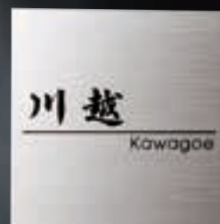
TI-3 チタンHL(黒) 25,000円(税抜) 家ロック対応 ● 150W×150H×2T(mm) 約200g ● 書体: 行書&アバンテ