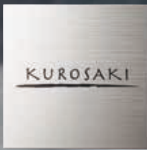
TI-7 チタンHL(黒) 28,000円(税抜) ● 180W×180H×2T(mm) 約290g ● 書体: ヘルクラウン