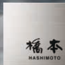
TI-8 チタンHL(黒) 25,000円(税抜) 家ロック対応 ● 150W×150H×2T(mm) 約200g ● 書体: 現代書体&ヘルペチカ