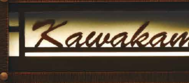
ウォームイエロー