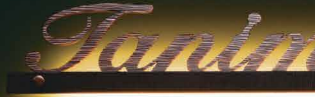
ウォームイエロー